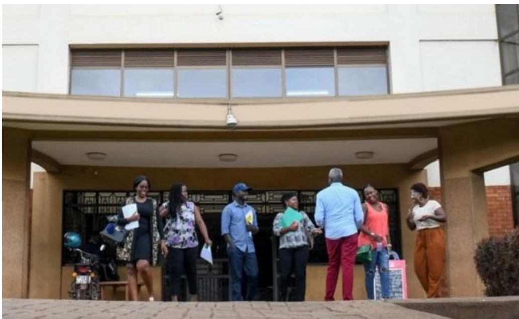
Kampala Universitet i Uganda