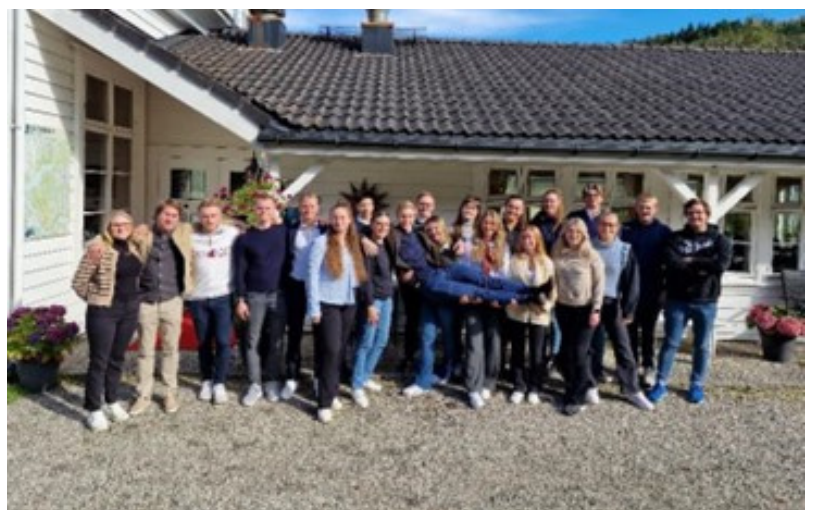
Deltagerne i RYLA Vest 2022 foran Fjordslottet hotell.