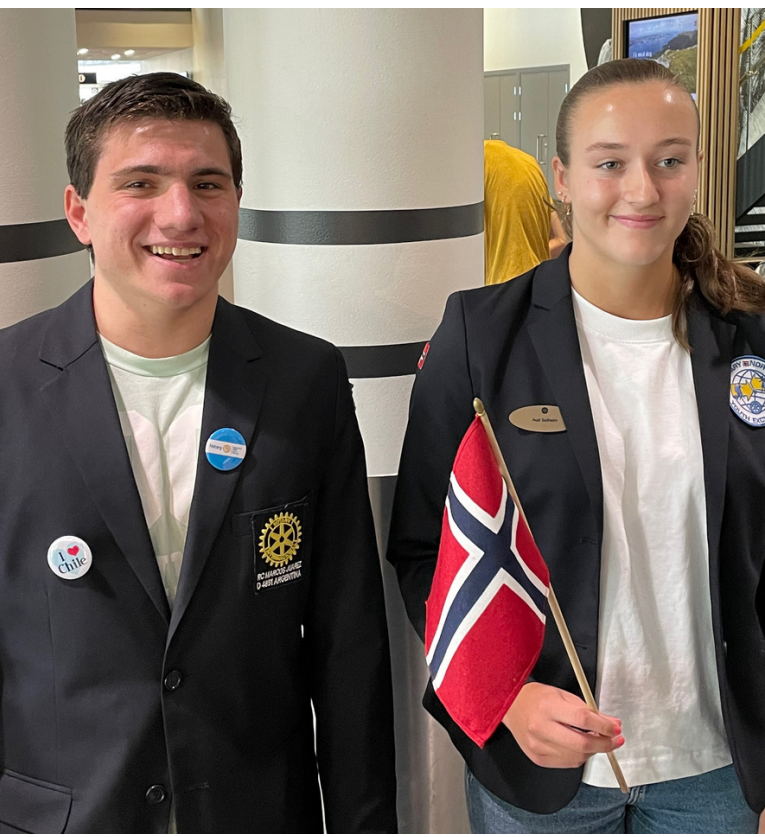
Larina fra Sveits.